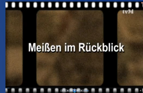
Magazin mit Nachrichten von vor 15 Jahren