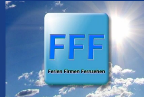
Ferien Firmen Fernsehen Das sommerliche Magazin